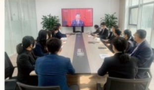
(集团行管、康嘉党委)